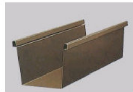
カラーバリエーション